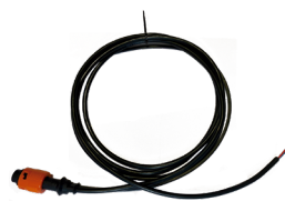
Ref. DY-401060 Cableado Izquierdo Trasero 2500mm* + Conector para serie Zeus