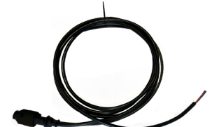
Ref. DY-401061 Cableado Derecho Trasero 2500mm* + Conector para serie Zeus