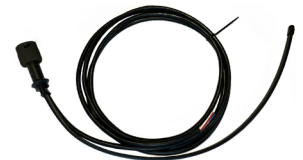
Ref. DY-401063 Cableado Derecho Trasero 2500mm* + Salida de Manguera Plana (Posición) + Conector para serie Zeus