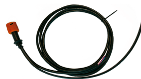
Ref. DY-401062 Cableado Izquierdo Trasero 2500mm* + Salida de Manguera Plana (Posición) + Conector para serie Zeus