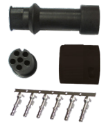
Ref. 506787 Kit Conector Hembra 5 Pin Lado Derecho