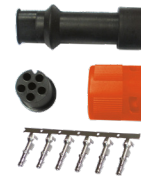
Ref. 506786 Kit Conector Hembra 5 Pin Lado Izquierdo