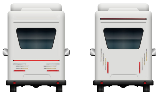
Ejemplos de montaje