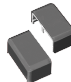
Ref. 503952 Tapón cierre Gris para Piloto Épsilon