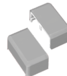
Ref. 503953 Tapón cierre Gris Claro para Piloto Épsilon