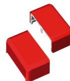
Ref. 503950 Tapón cierre Rojo para Piloto Épsilon